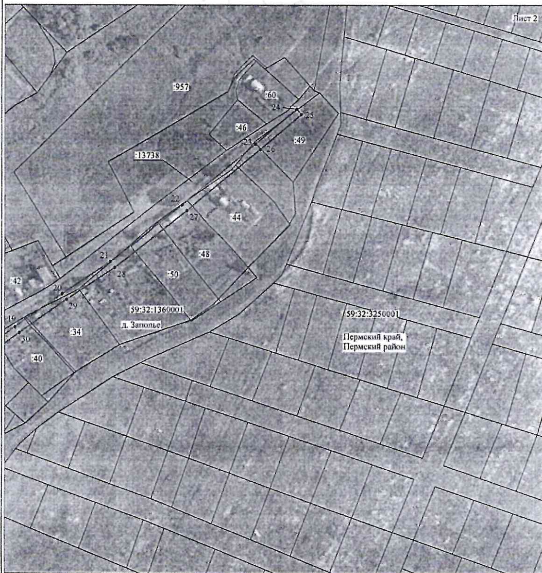
Схема расположения границ публичного сервитута объекта